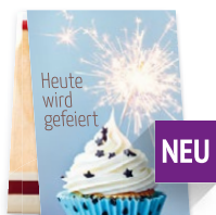
SB042 10 Streichhölzer für Feiern aller Art