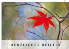
KP346 Trauerkarte mit Saattüte für blühende Erinnerungen