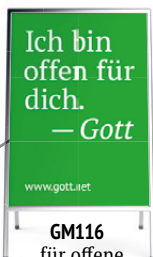
GM116 für offene Kirchen und Gemeindehäuser

Holen Sie sich Unterstützung: mit Schaukastenplakaten, Multimedia-Inhalten für Gottesdienste, Andachts-Entwürfen und mehr. Werden Sie als Gemeinde in der Öffentlichkeit sichtbar und einladend.