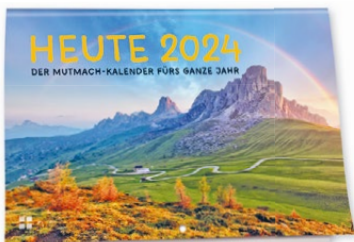
KA044 Einer von 7 Kalendern für unterschiedliche Ziel- und Altersgruppen

Ergreifen Sie die Gelegenheiten, die das Jahr bietet – von Neujahr bis Weihnachten. Beschenken Sie Menschen zu ihren großen Festen – Geburt(stag), Hochzeit, Ruhestand & Co. Und begleiten Sie mit guten Worten durchs Leben – in schönen und schweren Momenten.