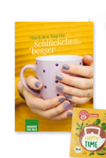
KP360 mit Tee um einen Moment der Stille in hektischen Zeiten zu genießen