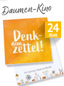
KP408 Block mit 24 Haftzetteln Motivationsprüche für Notizen aller Art