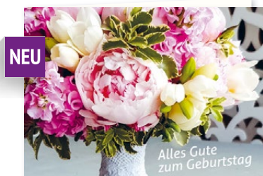
K0562 Eine von ca. 20 Geburtstagskarten