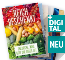
PL017 Plakate-Set DINA2: Sechs von unzähligen Motiven fürs ganze Jahr