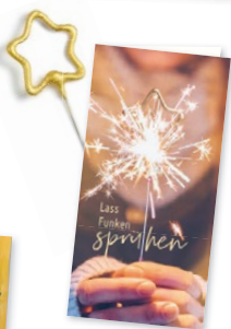
KP412 mit Wunderkerze um besondere Momente und besondere Menschen zu feiern