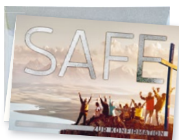
K0522 Zur Konfirmation mit feierlichem Umschlag

! Ob große Feste des Kirchenjahres oder persönliche Freuden und Herausforderungen – nutzen Sie diese Gelegenheiten und sagen Sie mit Marburger Medien mehr als nur herzliche Grüße.