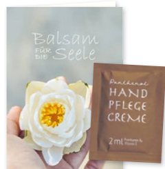
KP407 mit Handcreme und Tipp zur Seelenpflege